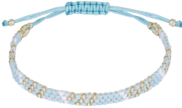
Armband handgeknüpft Hellgrün Art. Nr: 13111363 UVP € 19,99