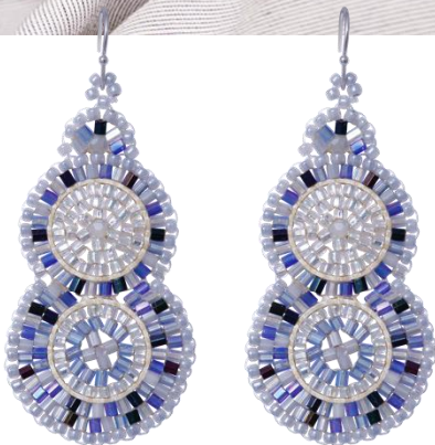
Handgefertigte Ohringe Blau Art. Nr: 13131441 ; UVP € 59,99