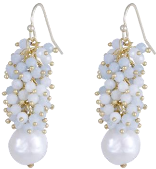
Zarte Ohringe mit Aquamarine und Perle, vergoldet Art. Nr: 13342146; UVP € 79,99