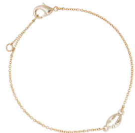
Armketten Muschel vergoldet Art. Nr: 13342279; UVP 49,99