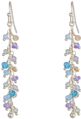
Ohrhänger mit Amethyst, Labradorite, blauem Topaz und Aqua Calci vergoldet Art. Nr: 13342139; UVP € 59,99