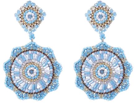
Handgefertigte Ohrringe Hellblau Art. Nr. 13342118; UVP € 89,99