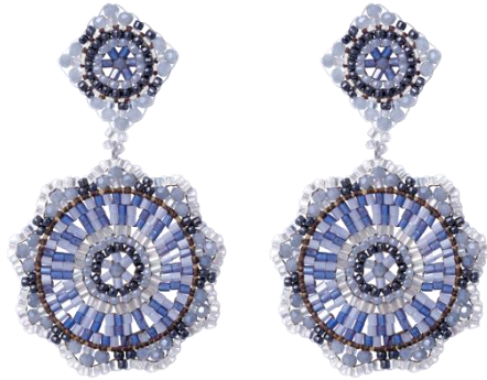
Handgefertigte Ohrringe Blau/Silber; Art. Nr: 13131427; UVP € 89,99