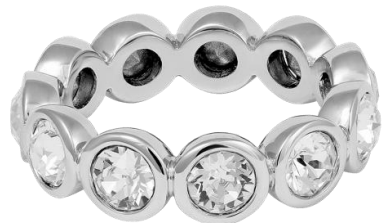
Ring mit Swarovski® Kristallen rhodiniert, Art. Nr: Small 13342447; Medium 13342454; Large 13342461; UVP € 59,99