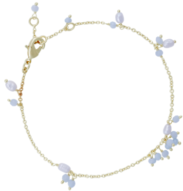
Zartes Armband mit Aquamarine und Perle, vergoldet Art. Nr: 13342356; UVP € 49,99