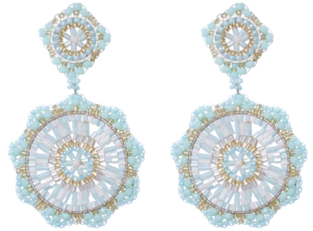
Handgefertigte Ohrringe Hellgrün Art. Nr. 13131432; UVP € 89,99