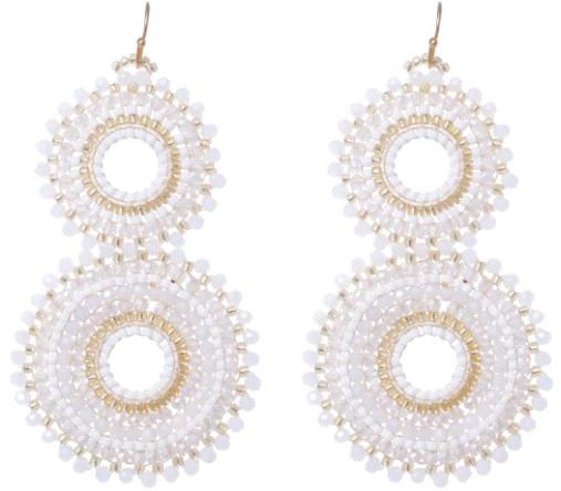
Handgefertigte Ohringe Weiß/Gold Art. Nr: 13342125; UVP € 84,99