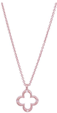
Kette Dots; rosé vergoldet Art. Nr: 13342391; UVP € 49,99