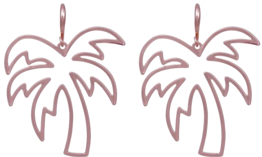
Große Palmenohrringe rosé vergoldet Art. Nr: 13131481; UVP € 49,99