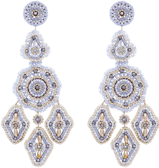
Handgefertigte Ohringe groß Grau/Gold Art. Nr: 13131447; UVP € 179,99