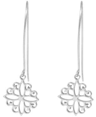
Zarte Ohrhänger Ornament rhodiniert Art. Nr: 13300951; UVP € 39,99