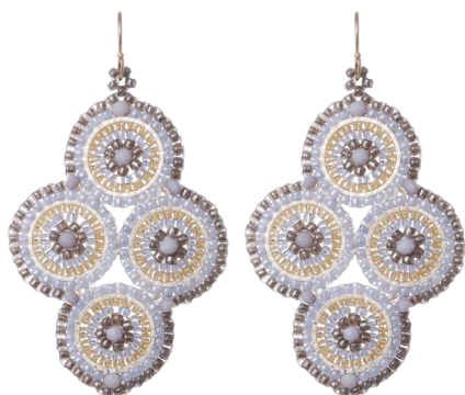
Handgefertigte Ohringe Hellgrau/Grau Art. Nr: 13131452; UVP € 79,99