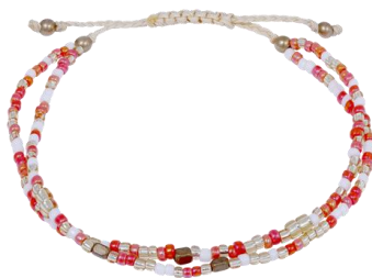
Handgefertigtes Armband Orange; Art. Nr: 13342377; UVP € 19,99