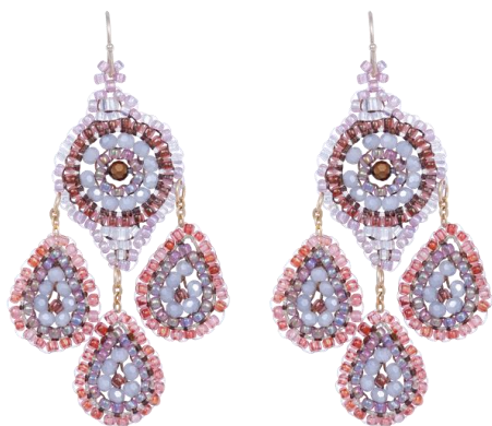
Handgefertigte Ohringe Rosa/Grau Art. Nr: 13131448; UVP € 89,99