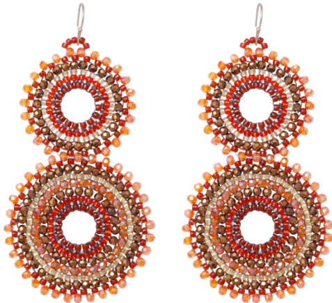
Handgefertigte Ohringe Orange; Art. Nr: 13131423; UVP € 89,99