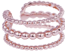
Ring mit Dots rosé vergoldet, UVP € 69,99 Art. Nr: Small 13342426 Medium 13342433, Large 13342440