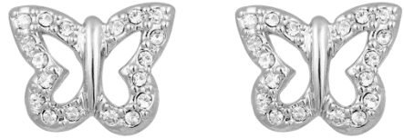
Ohrstecker Schmetterling mit Kristallen Art. Nr: 13342195; UVP € 39,99