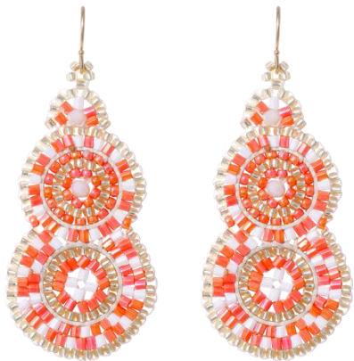
Handgefertigte Ohringe Koralle Art. Nr. 13342132; UVP € 59,99