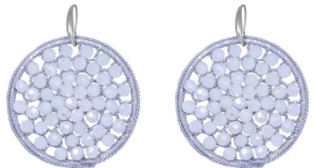
Handgefertigte Ohrringe Weiß/Grau Art. Nr. 13342272; UVP € 79,99