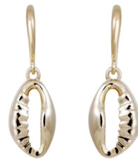
Ohrhinge Muschel vergoldet Art. Nr: 13342230; UVP € 49,99