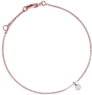
Zartes Armkettchen mit Kristall rosé vergoldet Art. Nr: 13342286; UVP € 39,99