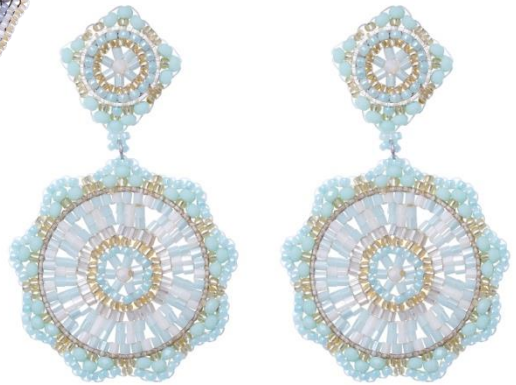
Handgefertigte Ohringe Hellgrün; Art. Nr: 13131432; UVP € 89,99