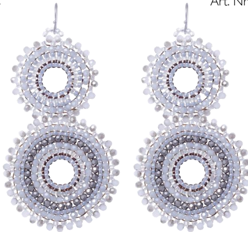
Handgefertigte Ohringe Grau/Silber Art. Nr: 13131417 UVP € 89,99

...und noch viele viele Farben mehr im CAJOY Store Seilergasse 3, 1010 Wien