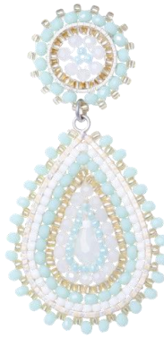
Handgefertigte Ohrhinge Hellgrün Art. Nr: 13131437; UVP € 89,99