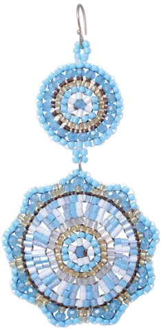
Handgefertigte Ohrhinge Hellblau/Gold Art. Nr: 13131435; UVP € 89,99