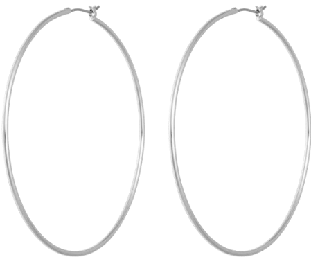
Große Kreolen rhodiniert, Durchmesser 6,5cm Art. Nr: 13342167; UVP € 59,99