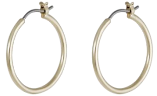
Kreolen vergoldet Art. Nr: 13342160; UVP € 39,99