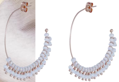
Kreolen hellblau, rosé vergoldet, Art. Nr: 13131478; UVP € 69,99