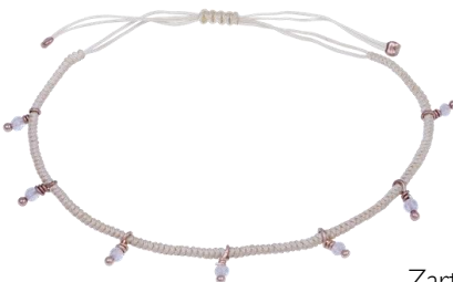
Zartes Armband rosé vergoldet Art. Nr: 13342349; UVP € 29,99