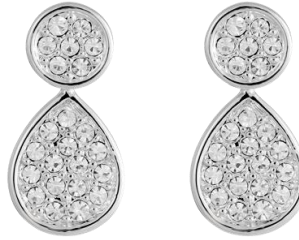
Ohringe mit Kristallen rhodiniert Art. Nr: 13342265; UVP € 49,99