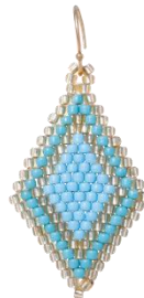
Handgefertigte Ohrhinge Türkis/Hellblau Art. Nr: 13131443; UVP € 49,99