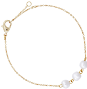
Armband mit Perlen vergoldet Art. Nr: 13342314 UVP € 39,99