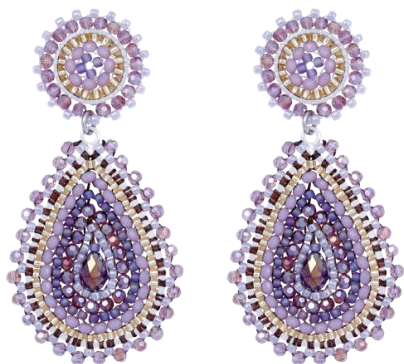
Handgefertigte Ohringe Violett Art. Nr: 13131439; UVP € 89,99