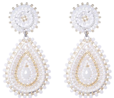
Handgefertigte Ohrringe Weiß/Gold Art. Nr: 13131436; UVP € 89,99