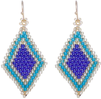
Handgefertigte Ohringe Türkis/Blitzblau Art. Nr: 13131444; UVP € 49,99