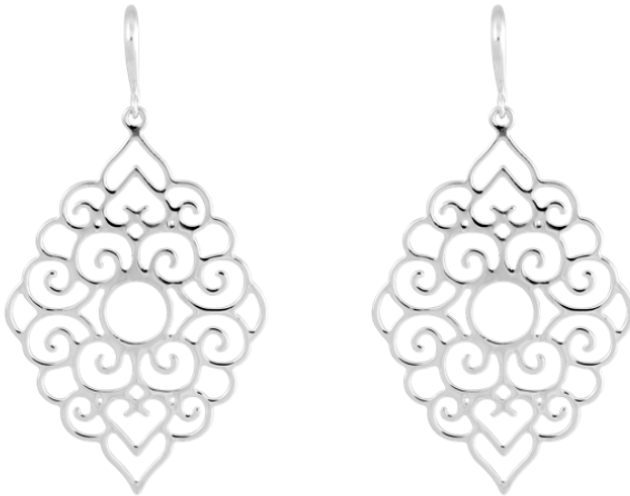
Ohringe mit Ornament-Anhänger rhodiniert; Art. Nr: 13342258; UVP € 79,99