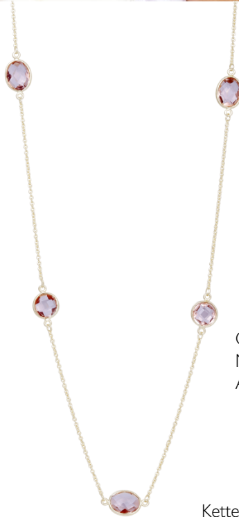
Kette vergoldet mit Morganite Hydro; Art. Nr: 13342419; UVP € 79,99