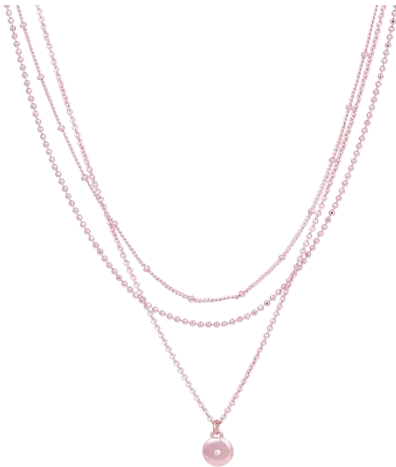
Layering Kette rosé vergoldet, Art. Nr: 13342412; UVP € 79,99