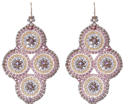
Handgefertigte Ohringe Rosa/Grau Art. Nr: 13131451; UVP € 79,99