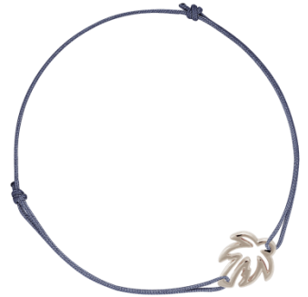
Armband Palme vergoldet Art. Nr: 13342293; UVP € 24,99