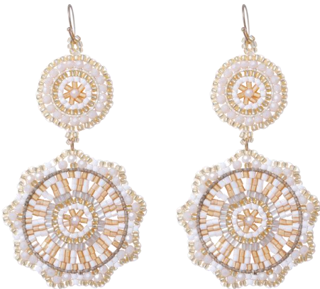
Handgefertigte Ohrringe Weiß/Gold Art. Nr: 13131433; UVP € 89,99