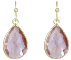
Ohringe vergoldet mit Morganite Hydro Art. Nr: 13342223; UVP € 39,99