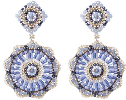
Handgefertigte Ohrringe Blau/Gold; Art. Nr: 13131428; UVP € 89,99