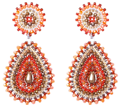
Handgefertigte Ohringe Orange Art. Nr: 13131438; UVP € 89,99