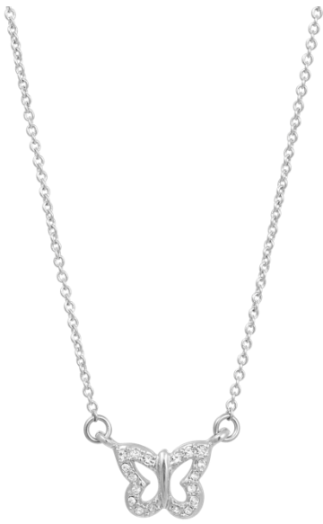
Zarte Schmetterlingskette mit Kristallen Art. Nr: 13342398; UVP € 49,99