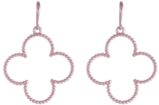
Ohrhinge mit Dots rosé vergoldet Art. Nr: 13342251; UVP € 49,99