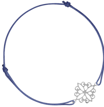
Zartes Armband Ornament rhodiniert; Art. Nr: 13342342 UVP € 34,99