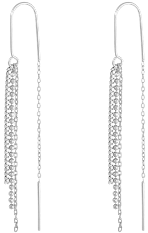
Ohringe mit Ketten rhodiniert Art. Nr: 13342244; UVP € 59,99