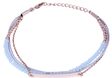
Armband rosé vergoldet, 3fach Art. Nr: 13342335; UVP € 49,99