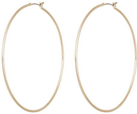
Kreolen vergoldet, Durchmesser 6,5cm Art. Nr: 13131480; UVP € 59,99